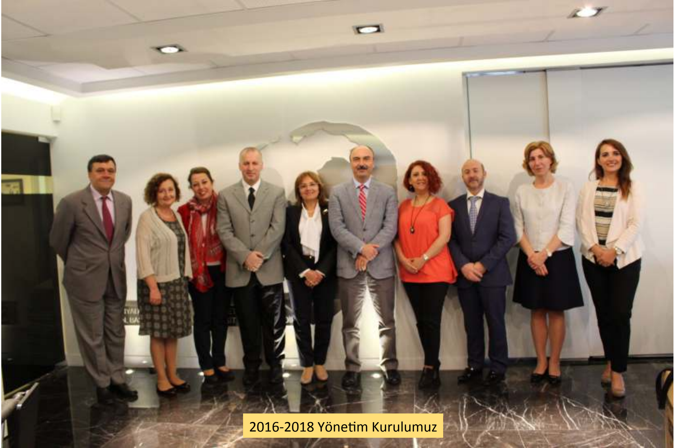
2016-2018 Yönetim Kurulumuz