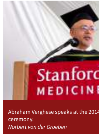
Abraham Verghese speaks at the 2014 ceremony.

When I studied anatomy, our final exam after one and a half years of dissection of the body was a three-hour paper with joint, one nerve, one vessel, one organ. We had pretty much memorized Grey's Anatomy in order to be able to answer the little bit. For example, there are 200-plus joints in the body, but only about 20 that are exam-worthy. So, I gambled on the