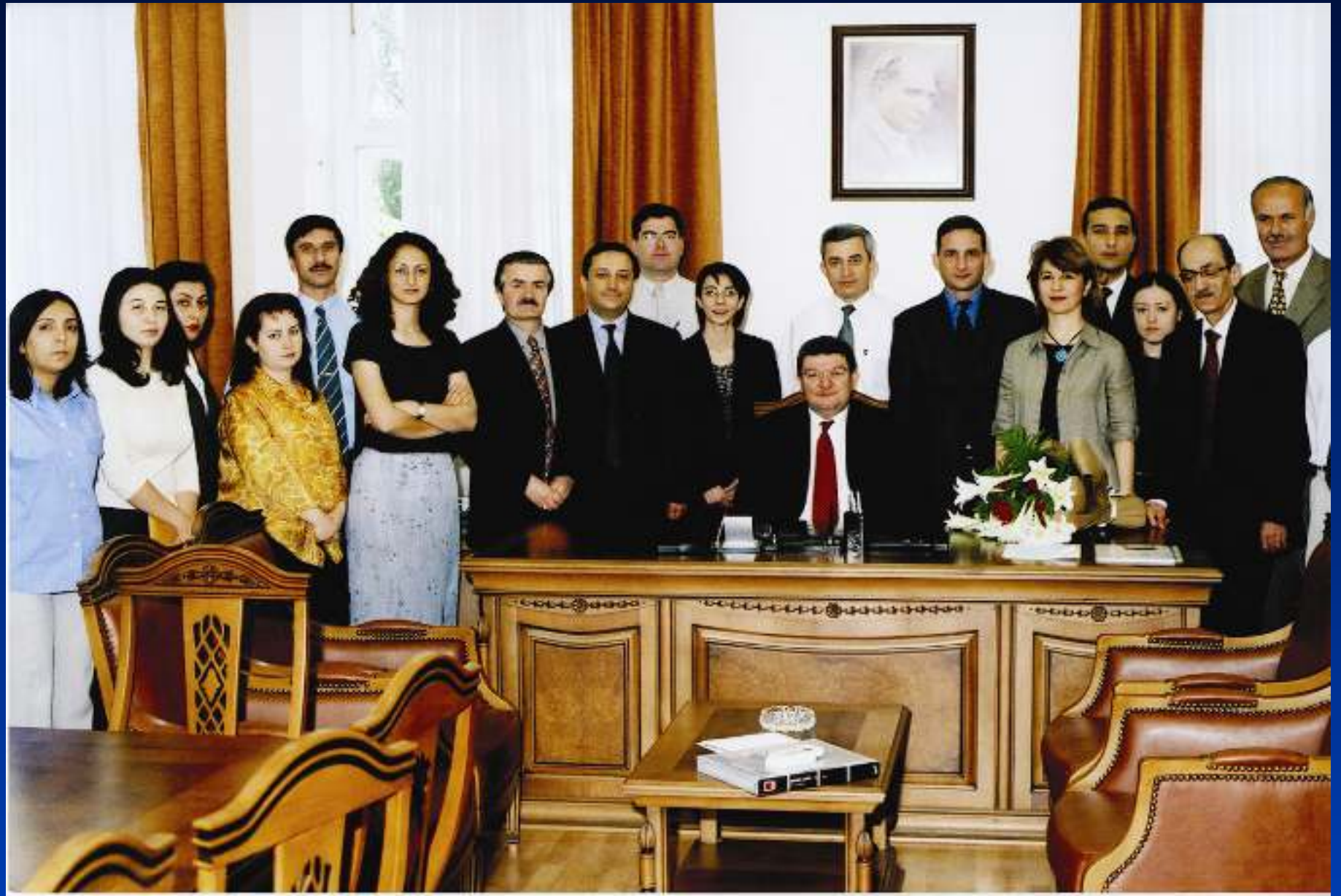
Refik Saydam Hifzıssıhha Merkezi Başkanlığı - 2003