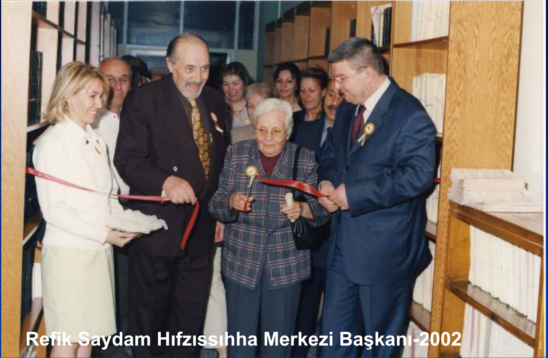
Refik Saydam Hıfzıssıhha Merkezi Başkanı-2002