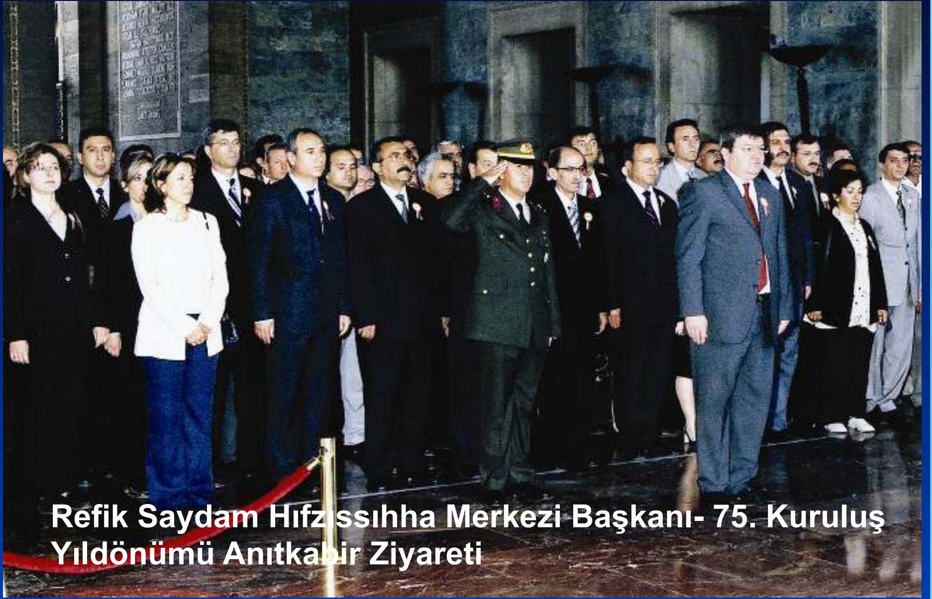
Refik Saydam Hıfzıssıhha Merkezi Başkanı- 75. Kuruluş Yıldönümü Anıtkabir Ziyareti