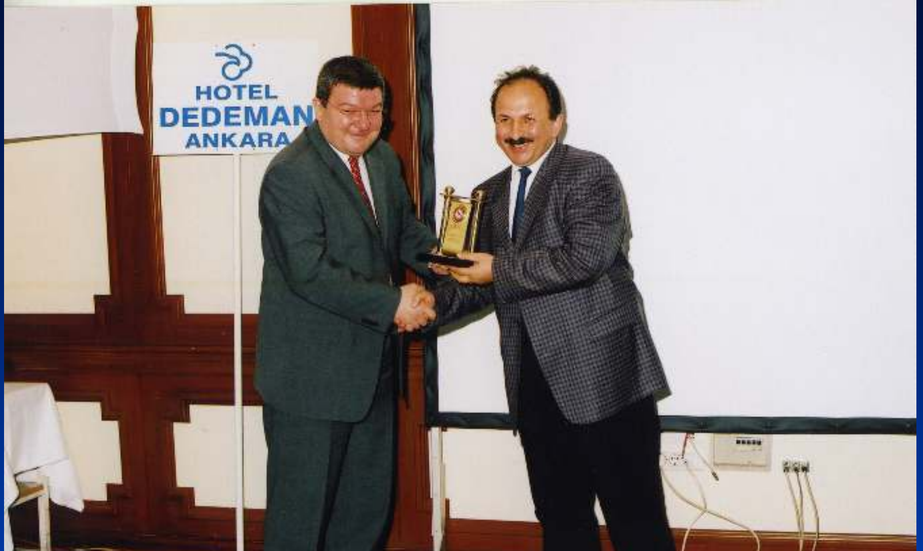
Refik Saydam Hıfzıssıhha Merkezi Başkanı- 75. Kuruluş Yıldönümü